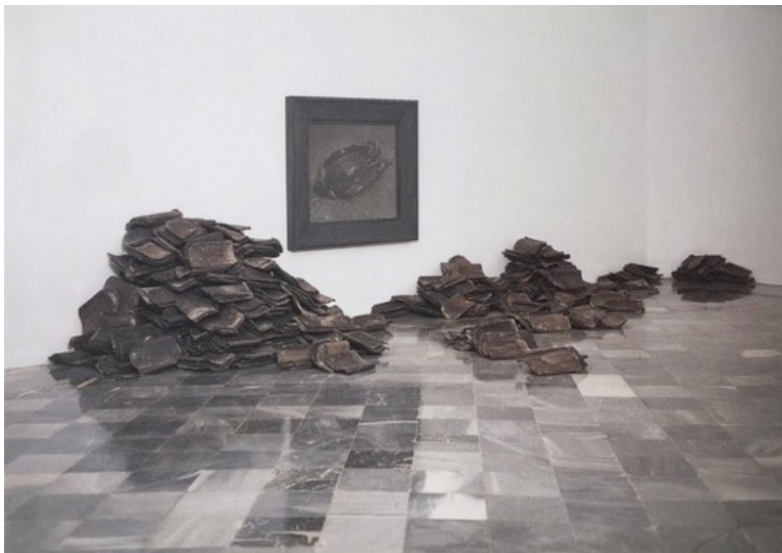
De anonieme getuigenis (1976-1985)