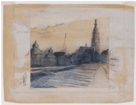
Raketstart vanuit de Bredase binnenstad, 1965