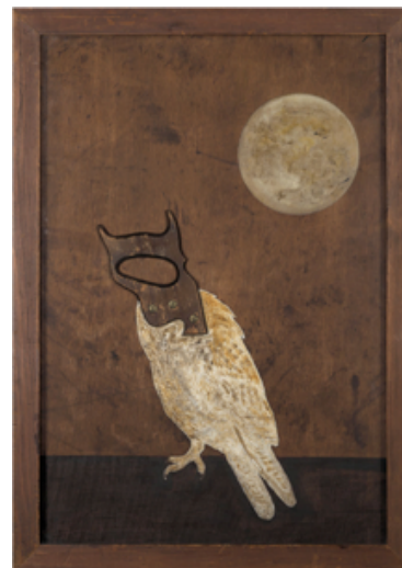
Twintig na middernacht (1968)