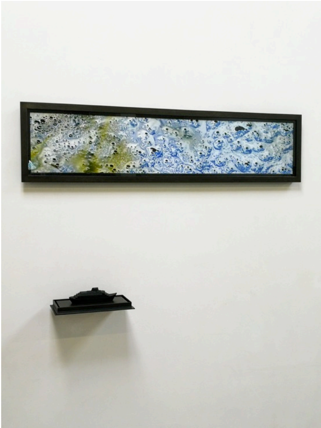
Sailing the Sea of Colour (2021)