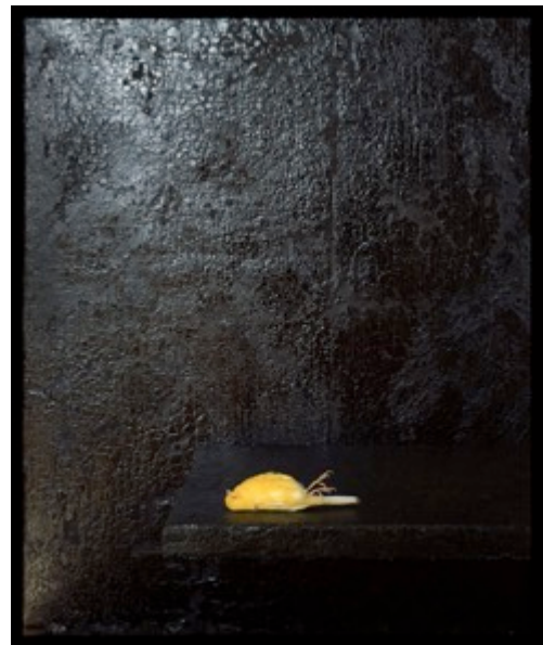
Nature Morte (Kanarie in Kolenmijn) (2004-2005)