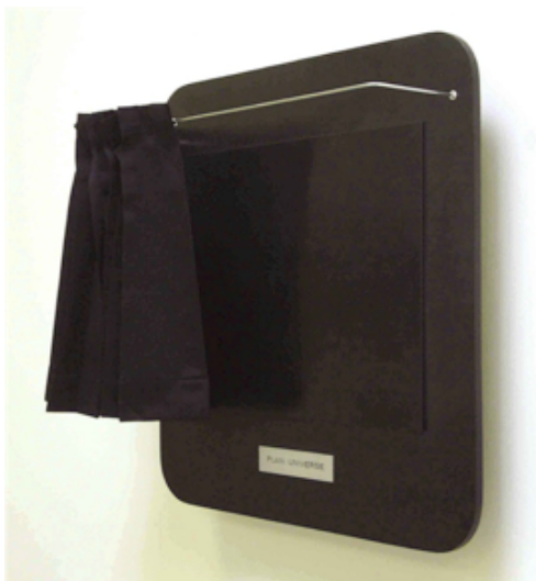
Plan Universe (1967)