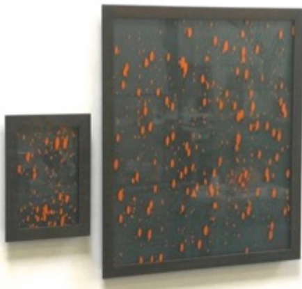
Depositum Saturnium (ongedateerd)

In de tentoonstelling Pieter Laurens Mol – Nachtlucht vormt de kleur zwart en de duisternis de leidraad om het oeuvre van Pieter Laurens Mol op een nieuwe manier te belichten. Mol beschouwt zwart als een verbindend element in zijn oeuvre. De inspirerende kracht en rijke symboliek van de kleur zwart en het duister maken deel uit van de thema’s die hij aansnijdt en van de materialen die hij gebruikt. Zwart is verbonden met zijn persoonlijke lezing van de kunstgeschiedenis en met zijn interesse in de alchemie, de kosmos en de ruimtevaart, met zijn liefde voor de nacht en het tweeduister en staat zo mede garant voor de melancholische ondertoon die verweven is met zijn kunstpraktijk.