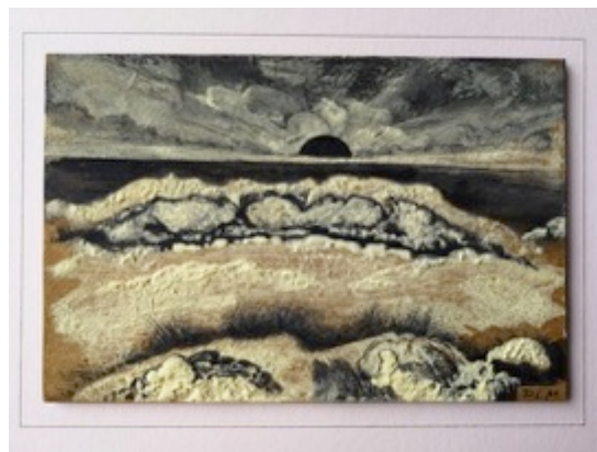
The Black Sun sets (ongedateerd)

Vanuit een verbondenheid met verschillende materialen onderzoekt Mol wat zwart en duister in de geschiedenis betekend heeft. Hij bespeurt daarbij een aan verandering onderhevige rol in de kunsten en wetenschappen. Dat wordt zichtbaar in zijn materiaal- en kleurgebruik. Houtskool en zwarte inkt, teer en de veren van een raaf zijn directe aanwijzingen. Maar ook hoe verschillende kleuren zich tot het onderwerp verhouden is belangrijk: denk aan de iriserende kleuren die zichtbaar worden door een olievlek op nat zwart asfalt of het bleekgele zwavel dat zijn toepassing kent als bestanddeel van zwart buskruit. Kenmerkend is zijn schilderwerk met orangerode loodmenie die als een haast romantisch avondrood verwijst naar Saturnus en de melancholie.