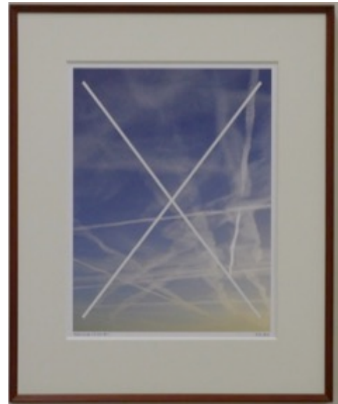
Cancellation (Either Way) (2014)

In de tentoonstelling wordt de bezoeker naar aanleiding van een veelheid aan betekenissen van zwart en duister meegenomen in het werk en oeuvre van Mol. Het eerste deel van de tentoonstelling functioneert als een 'antichambre', een voorvertrek waar toon en sfeer voor de tentoonstelling worden gezet. Een selectie van vroeg werk (jaren 60/70) toont Mol's fascinatie voor het zwart en het duister zoals het vanaf het begin van zijn kunstenaarschap aanwezig is en waarmee de ontwikkeling in deze kenmerkende beginperiode in beeld wordt gebracht. De aard van de werken – o.a. schetsen, schilderijen, foto's en objecten – in de antichambre is divers.