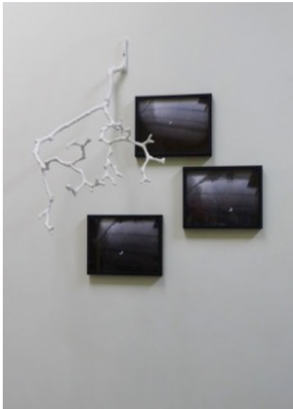
Crescent Reverie (2015)